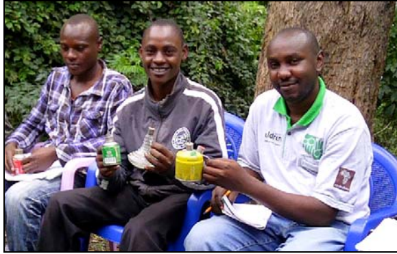
Jongeren hebben van oud materiaal een lampje gemaakt